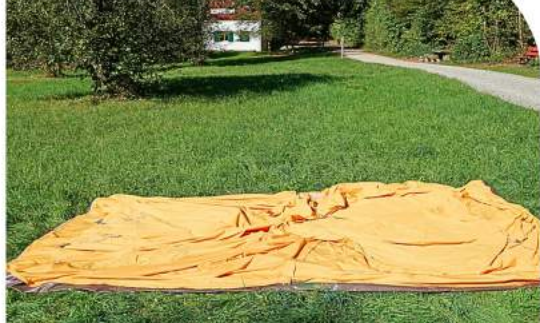
Innenzelt flach auslegen