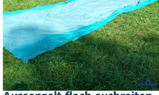
Aussenzelt flach ausbreiten