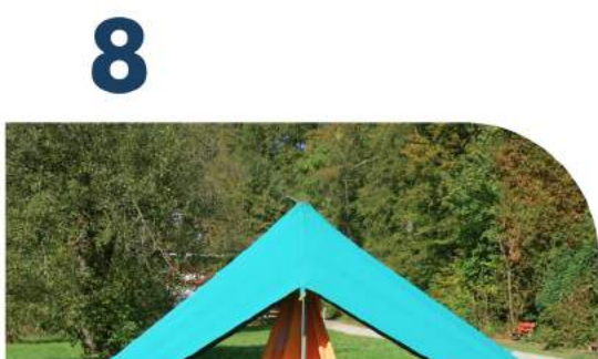
IZ mit Klett am Zeltstock befestigen