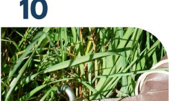
IZ mit Erdnägel spannen