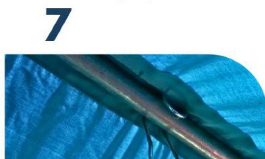
IZ an Firststange mit Haken befestigen