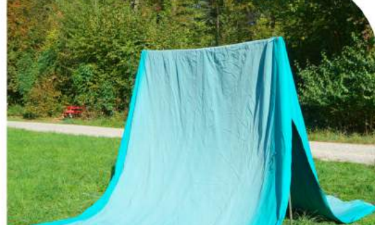
Zeltstöcke von unten durch Firstöse einfädeln