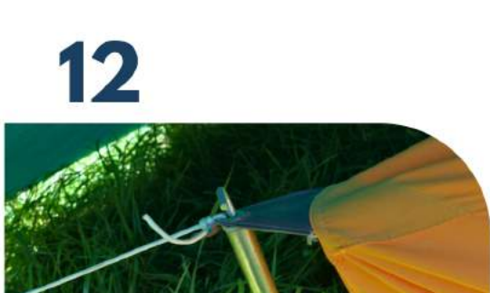
Eckstangen einführen und IZ straff spannen