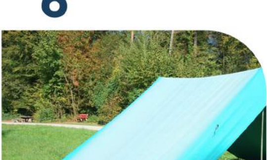
Restliche Schnüre abspannen