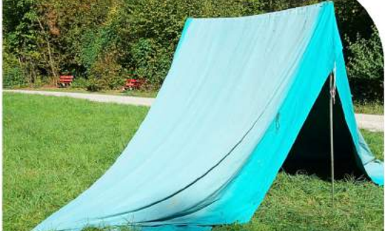
Mittlere Abspannungen mit Hering sichern