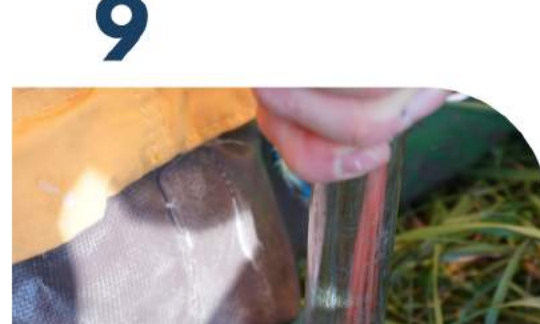
Zeltstock auf mittlerem D-Ring aufstellen