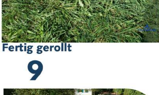
Aussenzelt flach auslegen