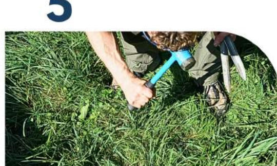
Ecken so rausspannen, dass beide anliegenden Stoffkanten gespannt sind.