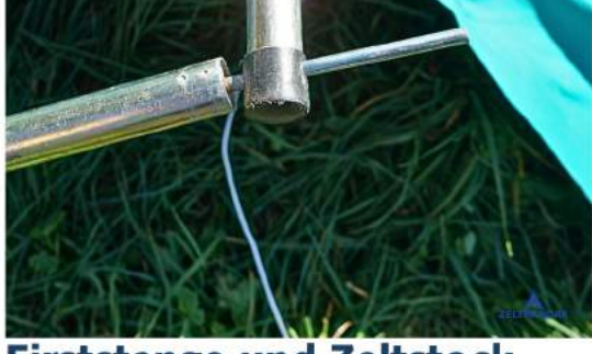
Firststange und Zeltstock verbinden